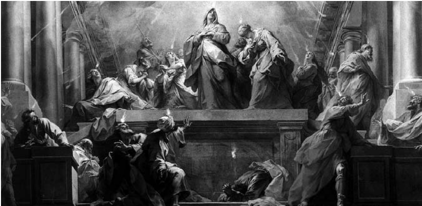
Restout, Jean II (1692-1768) Pentecost

Hisszük, hogy a Lélek érintésére ma is megváltoznak életek. Ma is bűnbánat ébred az őszinte kereső ember szívében. Tartozz te is azok közé, akik így ünnepelnek.